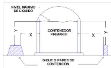
Figura 2.- Distancia de la pared de retención al Contenedor primario.