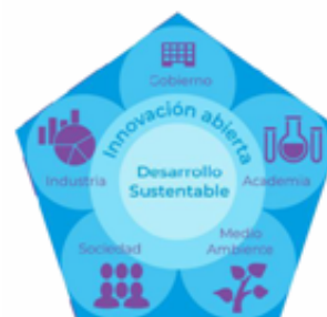
Figura 1. Modelo Pentahélice

Se desarrollará un ecosistema de innovación vinculatorio para el país, capaz de articular de manera efectiva los recursos actuales y futuros de Ciencia, Tecnología e Innovación, evolucionando de una triple a una pentahélice (Figura 1), mediante la incorporación de la sociedad y el medio ambiente como elementos fundamentales del modelo (Gobierno-Academia-Industria-Sociedad-Ambiente). De esta manera, se busca generar innovación por medio del desarrollo de conocimiento que integre las necesidades de la sociedad, la economía y la sustentabilidad, haciendo frente a problemas nacionales.